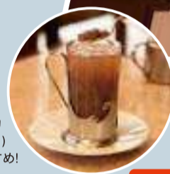
大納言小豆を煮た名物「ゆであずき」(550円)は甘党におすすめ!

台東区浅草4-20-3 ☎03-3875-2987 [営]9:00~21:00(ラストオーダー 20:30) [休]水 [HP]www.denkiya-hall.jp