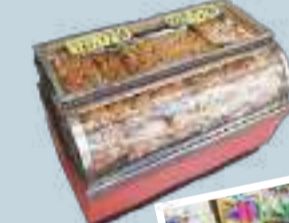
「玉子パン(200g)」230円。もちろん大人買いもどうぞ!

台東区浅草5-17-10 ☎03-3873-1908 [営]9:00~18:30 [休]毎月8日、18日、28日