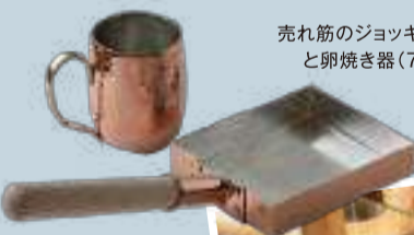
売れ筋のジョッキ(9,000円)と卵焼き器(7,500円)