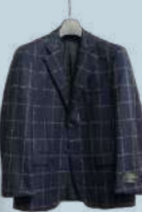
店主がほれ込んだというイタリア製ジャケット(43,000円)